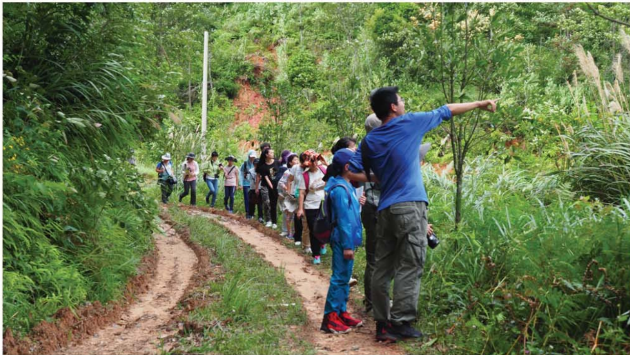
宣教中心志愿带领学生野外观察照片

我们的优势： 位置佳——项目点位于福州国家森林公园内，人流量大，受众面广，是重要的窗口单位。配备全——宣教中心拥有科普展区、电教室、手工活动室、自然阅读室等多个活动区域。趣味强——项目以野外观察为特色抓手，以室内学习为辅助，让宣教活动更加生动有趣。