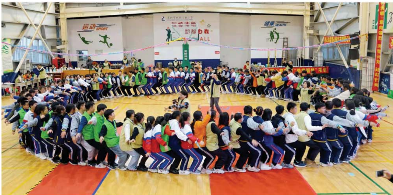
2022年1月同心助学圆梦项目开展冬令营

我们的优势： 课程支持。项目不仅在经济上帮助困境学子，更关注学子的心理健康与能力提升，每年通过成长课程帮助学子纾解压力、提升抗逆力与适应力。同青反哺。缘起于2012年，由受助学生自发成立，现有在册同青566名，成为项目主干力量，形成独具特色的“同青”志愿服务品牌。