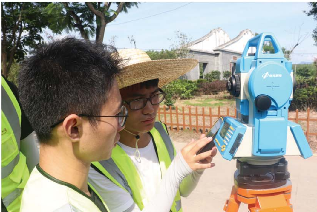
项目成员下乡测绘文物古迹

我们的优势： 项目为乡村绘制1:500高精度地形图，有效缓解了现有测规企业无法满足全国待改造村镇庞大需求的问题。团队积极与当地文明实践中心联系，目前已在乡镇搭建了6个志愿服务基地以及3个乡村振兴工作站，志愿服务效率、工作精度得到大幅提高。