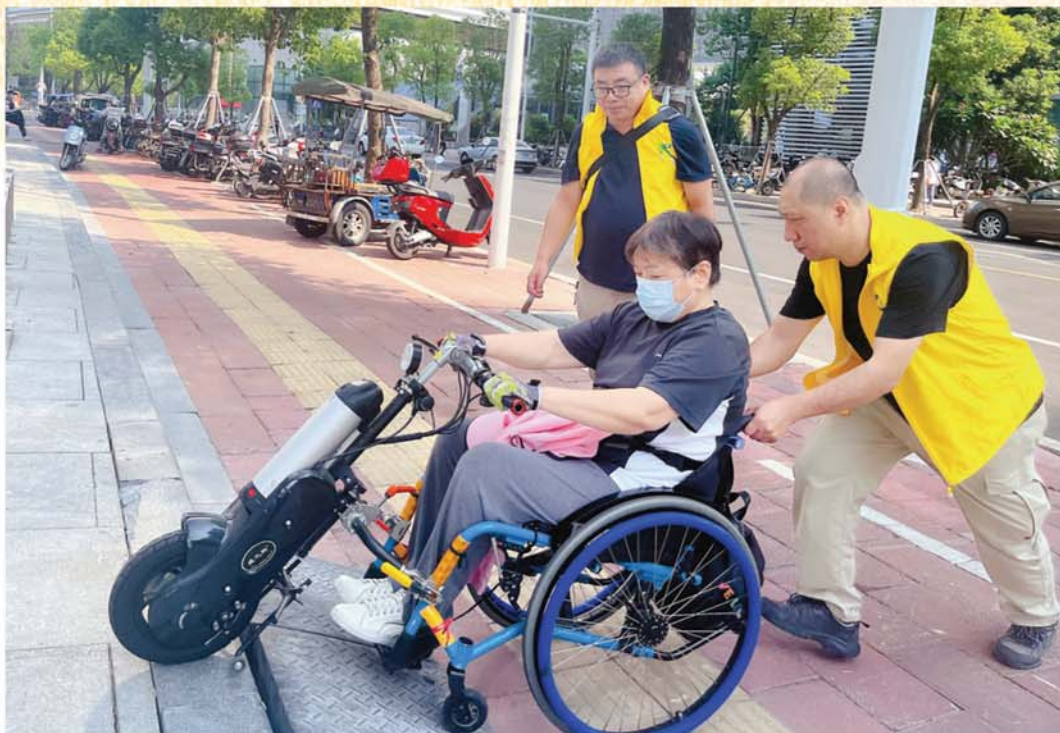
志愿者在帮扶残疾朋友