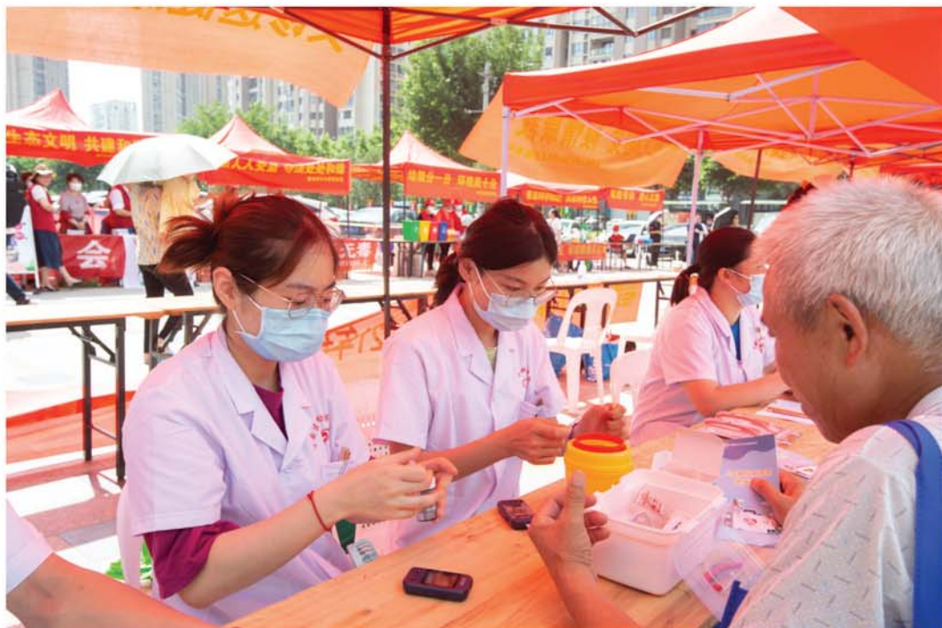
2021年6月11日，晋安区新店镇“医心医意”品牌项目开展线下常态化义诊志愿服务活动。

我们的优势： 背靠省会优质资源。链接省妇产医院、省疾控中心、福州市中医院等优质医疗资源，涵盖儿科、内科、保健科等诊疗科室。服务群众“最后一米”。“家庭医生”服务，推动医疗资源入户上门，居民足不出户享受免费的医疗健康服务。