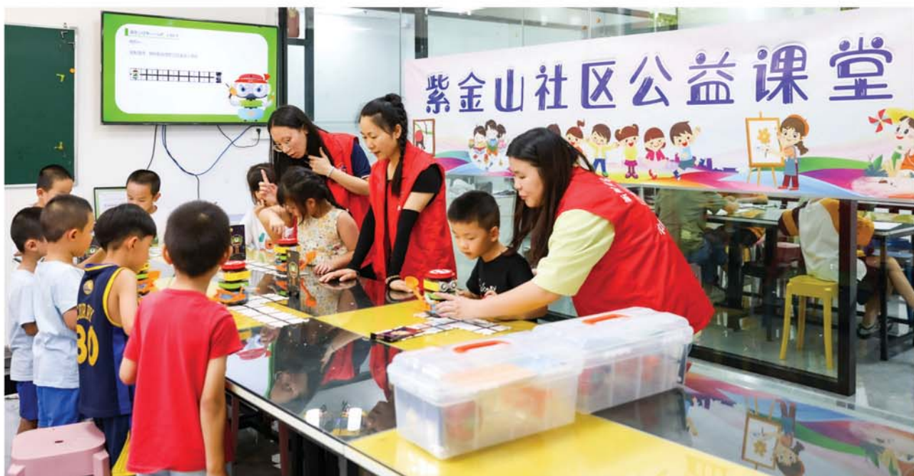
2022年8月20日 小不点课堂编程课

我们的优势： 项目核心成员均为社区干部，有过硬的服务意识和为民办实事理念；辖区居民参与志愿服务热情高，有17名“护苗妈妈”巾帼志愿者和13家爱心教育机构加入“小不点课堂”志愿服务项目；社区有比较好的公共配套活动设施和一套较完善的志愿服务激励机制。