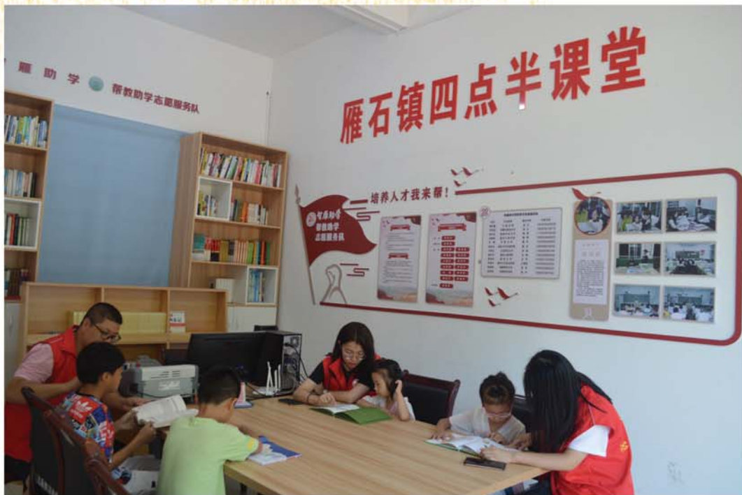
2021年9月29日志愿者到四点半课堂开展“帮教助学”志愿服务