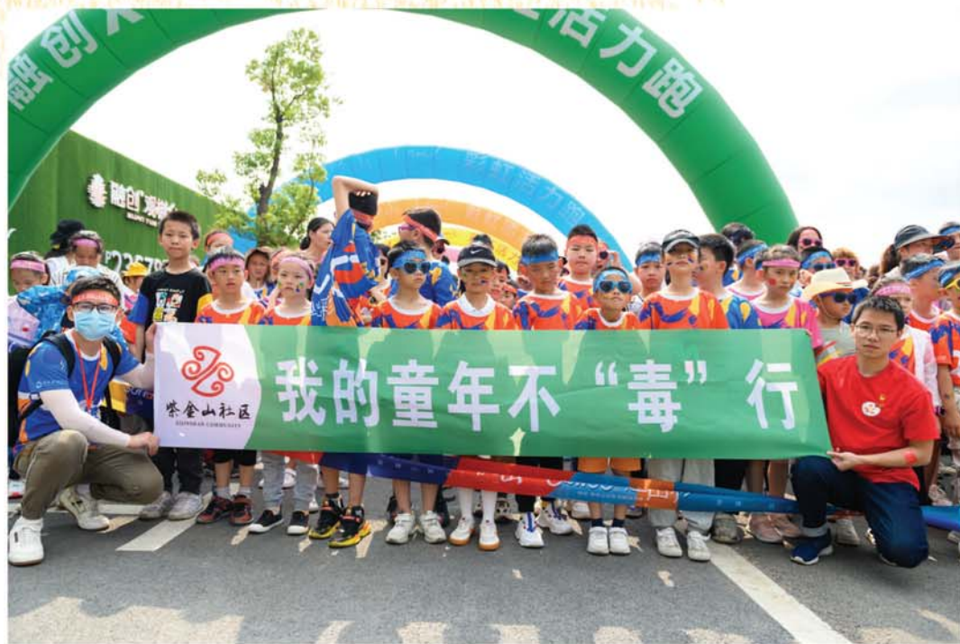
2022年4月25日，小紫侠志愿服务参与“健康人生·花样彩虹跑”活动