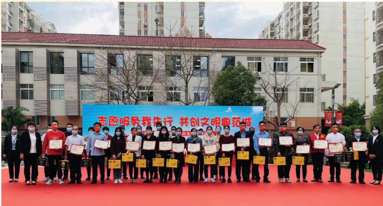
2021年12月10日优秀志愿者表彰大会