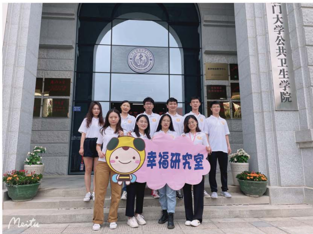
开“心”福见——低龄小学生心理健康志愿服务项目团队照片

我们的优势：正向指引，精准教学。兼具正向心理学理念和多元化教学风格，课程由公共心理健康促进专业教师指导培训。融教于趣，课程新颖。自主设计课程，独立研发推出桌游、手游和绘本产品。专业测评，成效显著。搭配心理健康及行为科学等亲子测评工具，全力打造“互联网+幸福”的预防模式。