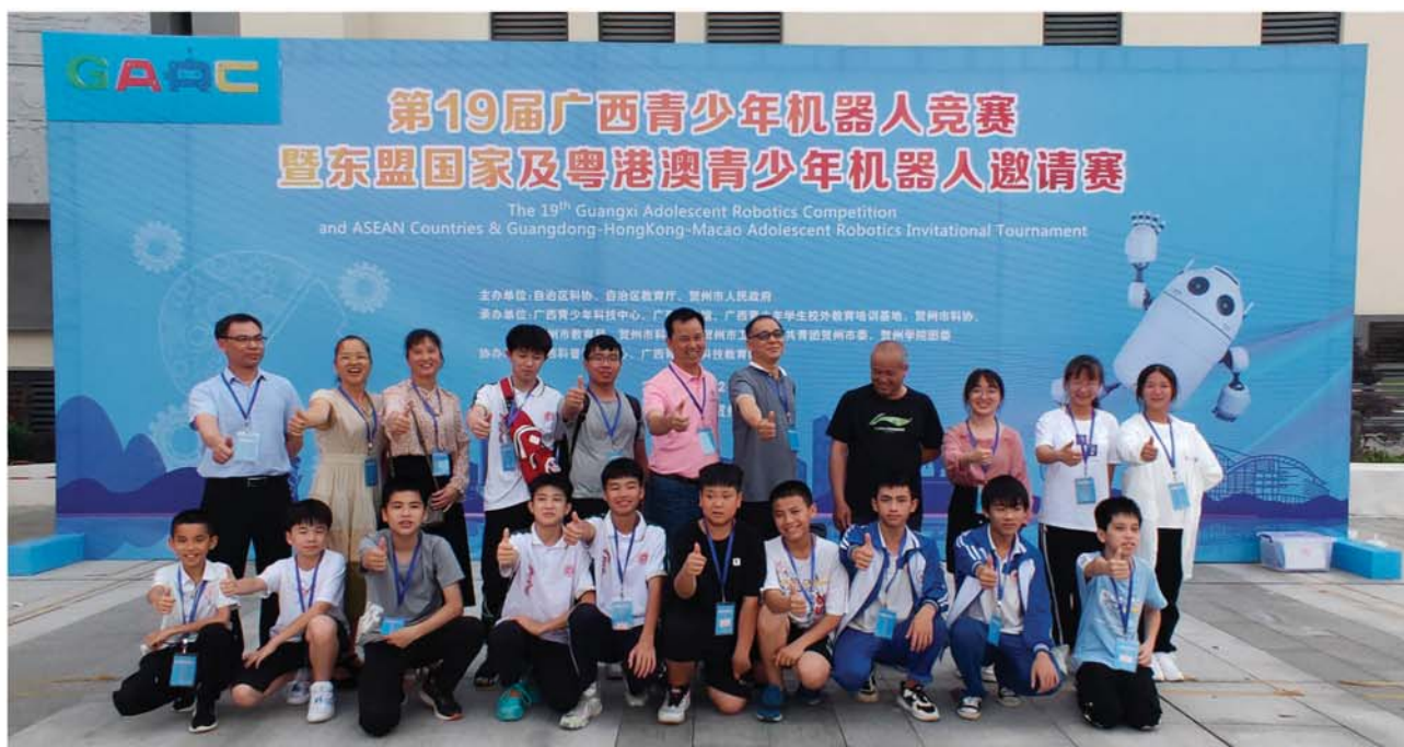
志愿者指导学生参加第19届广西青少年机器人竞赛并获奖

我们的优势：一是建立志愿服务网络，项目围绕科技启智和云端支教两个核心，以“科技课堂”、“芯愿服务”、“数字教育”、“品牌活动”为逻辑主线，不断延伸志愿服务网络。二是可持续性强，项目与广西武宣县实验中学为建立长期志愿服务合作方案，进一步推动科技教育发展的帮扶实践育人共同体。