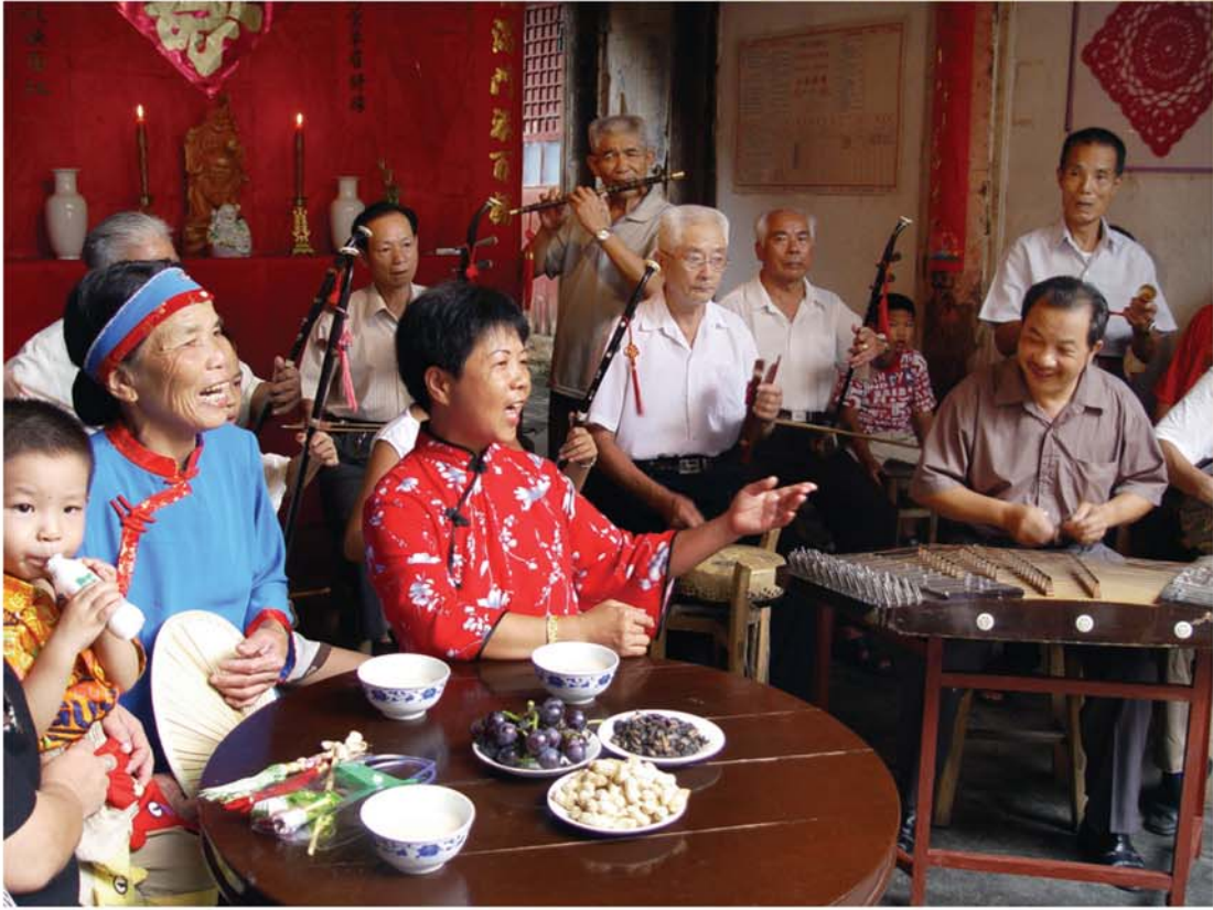
2021年7月20日，将乐县文化艺术志愿服务队开展“擂茶+”食闹音乐展演