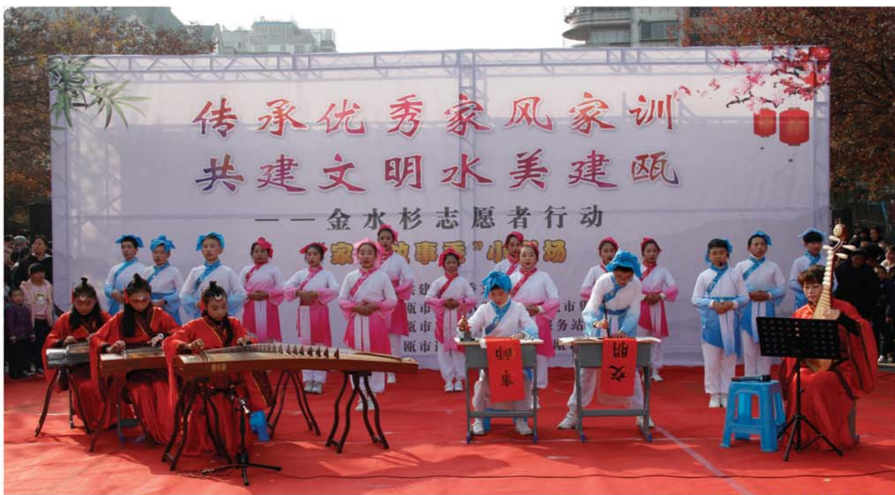
2019年11月13日少先队传承优秀家风家训 文明实践活动

我们的优势：项目具有旺盛的生命力，时做时新。家校联动强赋能，主题开发有创新，参与人数有保障，社会资源可利用，研学价值可推广。以“金水杉志愿者”形象影响社会，以“志愿服务精神”感染他人。