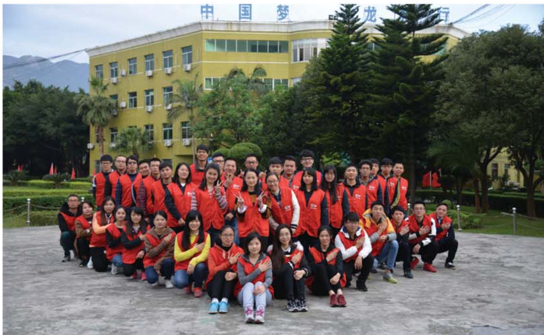
平潭公司光明号角学雷锋志愿者服务队

我们的优势：一是价值引领、常态长效。从立项至今，始终践行“人民电业为人民”企业宗旨，积累了丰富的项目实施经验。二是资源整合、汇聚爱心。整合内外优质资源，搭建扶贫帮困公益平台，拓展志愿服务品牌。三是科学谋划、干字当头。坚持项目化实施，对内常态化组织开展各类志愿服务活动，对外积极主动参加实验区及上级单位组织的志愿服务活动。