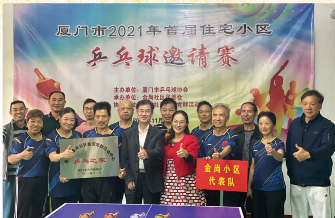
2021年11月28日厦门市乒乓球协会授予金国党群活动中心“乒乓之家”牌匾，金管家团队成员合照