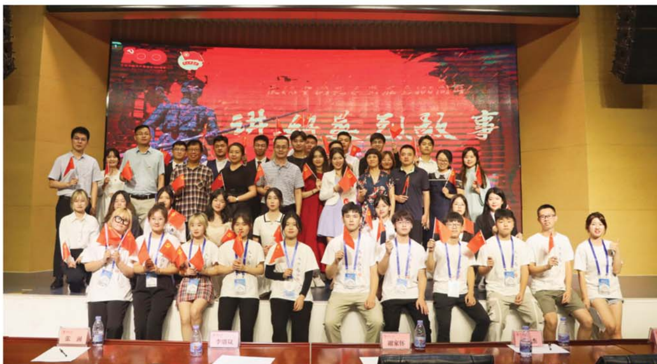
举办“讲好英烈故事”主题活动

我们的优势： 通过校地共建，吸纳港澳台侨学生，结合地方红色文化、党史侨情等开展志愿服务宣讲，厚植家国情怀，褒扬英烈精神，让青年学子在参加志愿服务中受教育、长才干，服务地方精神文明建设，打造城市文化名片，助推教育者和受教育者的双向成长。