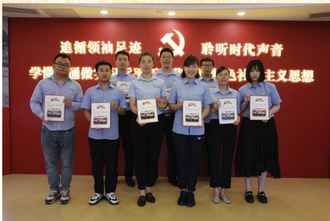
中信银行福州分行党建馆于2021年8月15日开展“学习新思想 奋斗新征程”全民学习宣传志愿服务活动——城市建设者专场