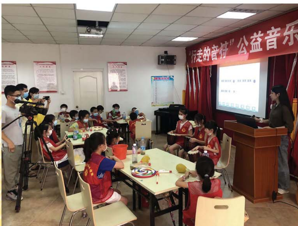
音乐素养课程活动现场