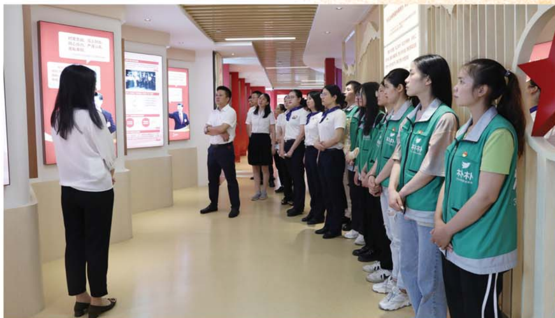
中信银行福州分行党建馆与2021年8月8日开展“学习新思想 奋斗新征程”全民学习宣传志愿服务活动——奉献着专场