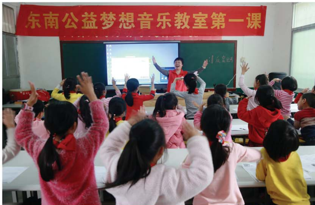
2019年3月28日，“爱心午餐·梦想音乐教室”第一课在安溪县潮碧小学开课

我们的优势：一是科学延伸、健康发展。从单纯的“爱心午餐”拓展衍生出多个助学支教于项目，成为可复制、可提升、可拓展的志愿服务品牌。二是资源链接、爱心汇集。为爱心企业、人士和偏远山区学校搭建起一个精准助学的爱心集散平台，成为泉州本土助学支教的品牌项目，社会公众参与度高，社会成效明显。三是大爱传承、公益反哺。受助学子心怀感恩，成为项目志愿者，爱心有传承、做法可持续。