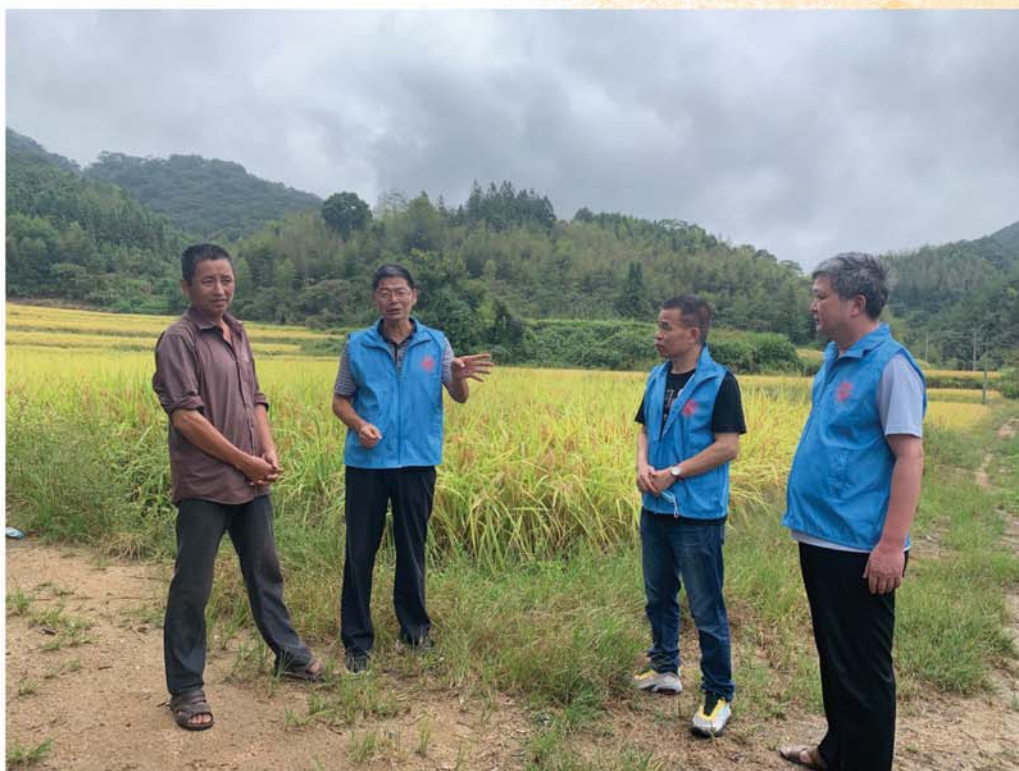
2021年9月24日，市农技协志愿服务队在三元区陈大镇渔溪村开展科技志愿服务活动