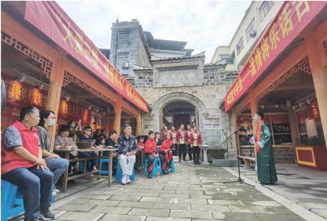
2022年5月21日，将乐县新时代文明实践中心开展“强国复兴有我 温情将乐话古今”擂茶+宣讲展演