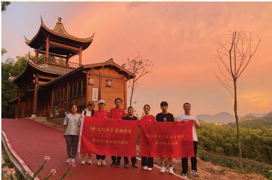
团队成员在光泽县金映茶园