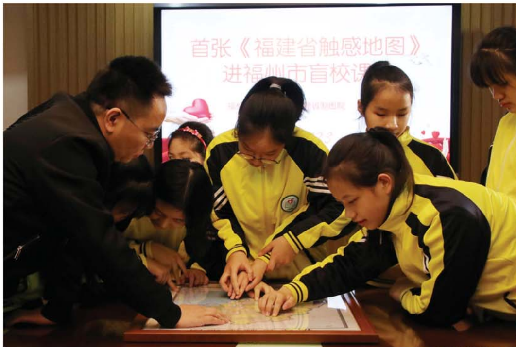
绘制《福建省触感地图》

我们的优势： 专业性强。深耕无障碍领域十年，团队志愿者骨干力量中有残障人士，真正了解残疾人需求。公信力高。与住建、城管、园林等政府部门保持良性互动，参与相关标准的制定，能够对无障碍环境提升改造提供合理建议。