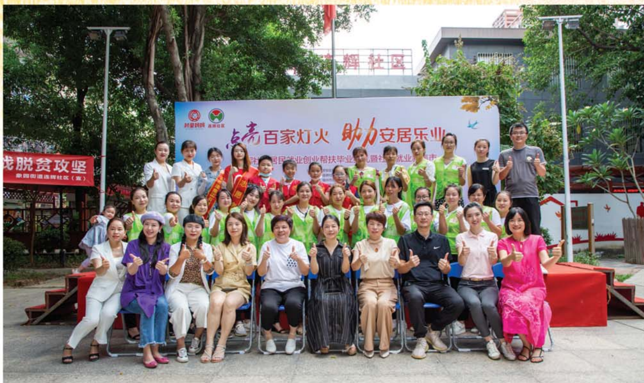
社区为村童妈妈举办毕业典礼