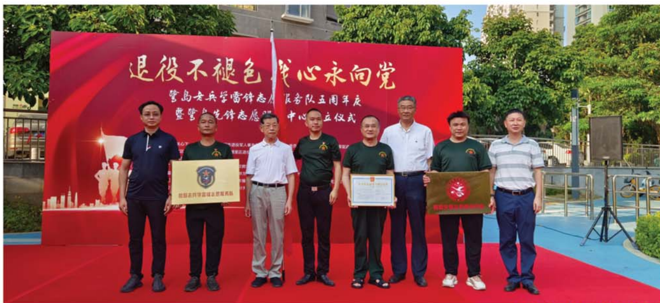
我心永向党 喜迎二十大

我们的优势：老兵队员作风过硬，忠诚度高，纪律意识强，敢打硬仗，勇于担当。队伍注重加强思想教育，服从意识强，吃苦担当，任劳任怨，奉献意识强。