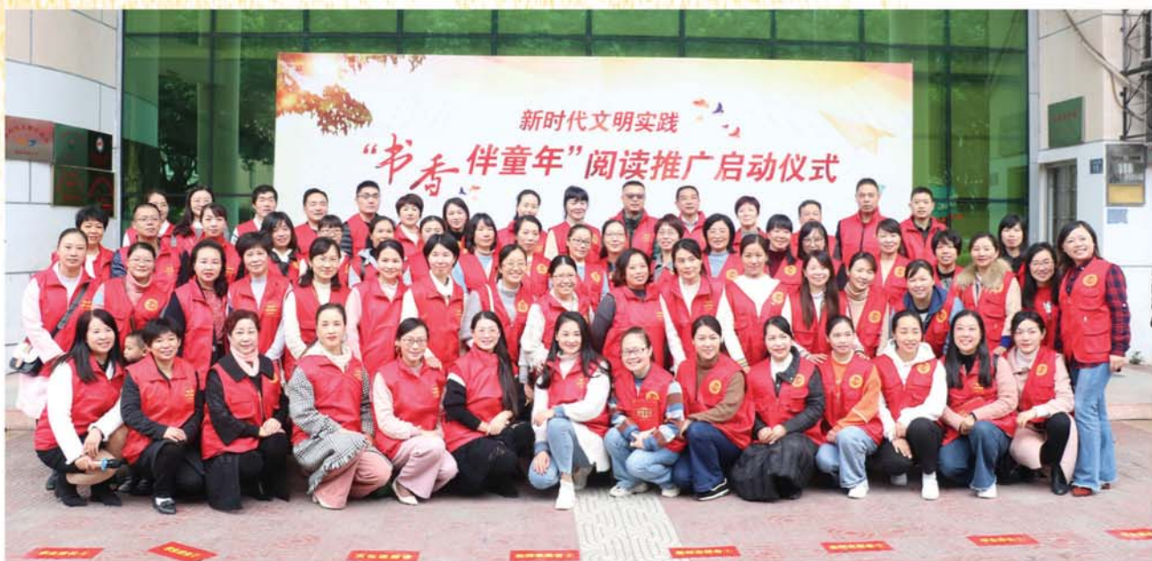
书香伴童年启动仪式