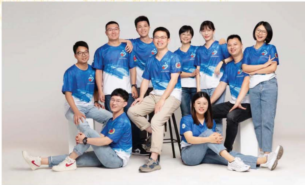
团队部分人员合照