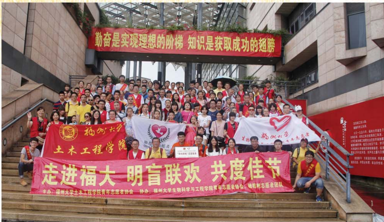
盲道优化改造家团队开展明盲联欢助盲活动