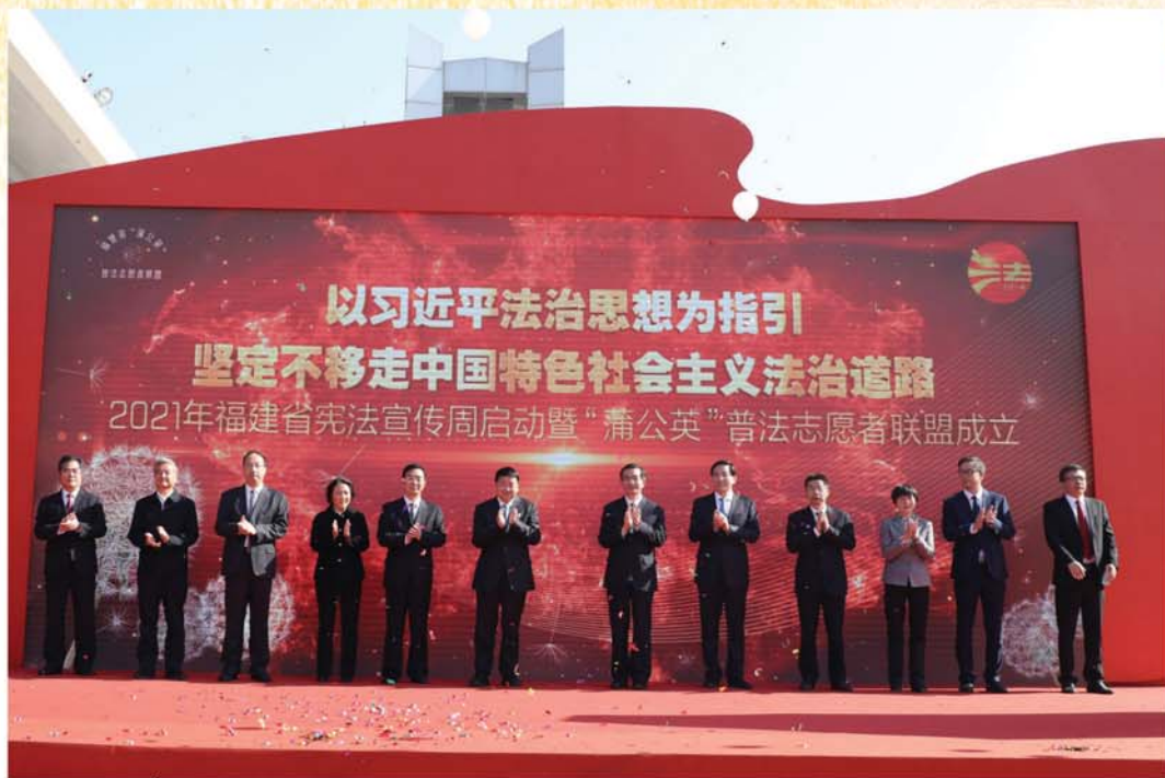
福建省举行“2021年宪法宣传周”启动暨“蒲公英”普法志愿者联盟成立仪式