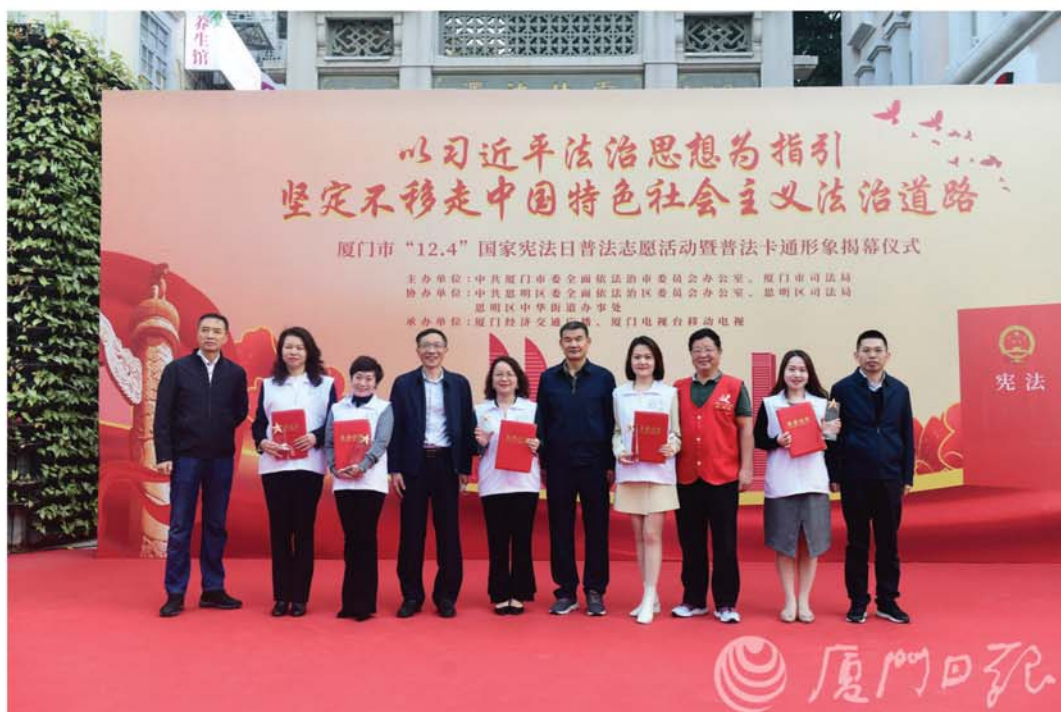
2021年12月4日举行办“最美巾帼普法志愿者”颁奖仪式

我们的优势：理念温情，从女性的角度理解、关心、保护合法权益受侵害的女性。力量专业，100名女性志愿者发挥法律专业特长，宽领域、多维度开展服务。科技赋能，搭载传统媒体与新媒体，“海陆空”全覆盖开展服务式、互动式、场景式普法。