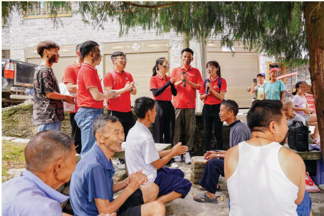
2021年7月项目成员在报效村与村民开展音乐党课讲述党史故事