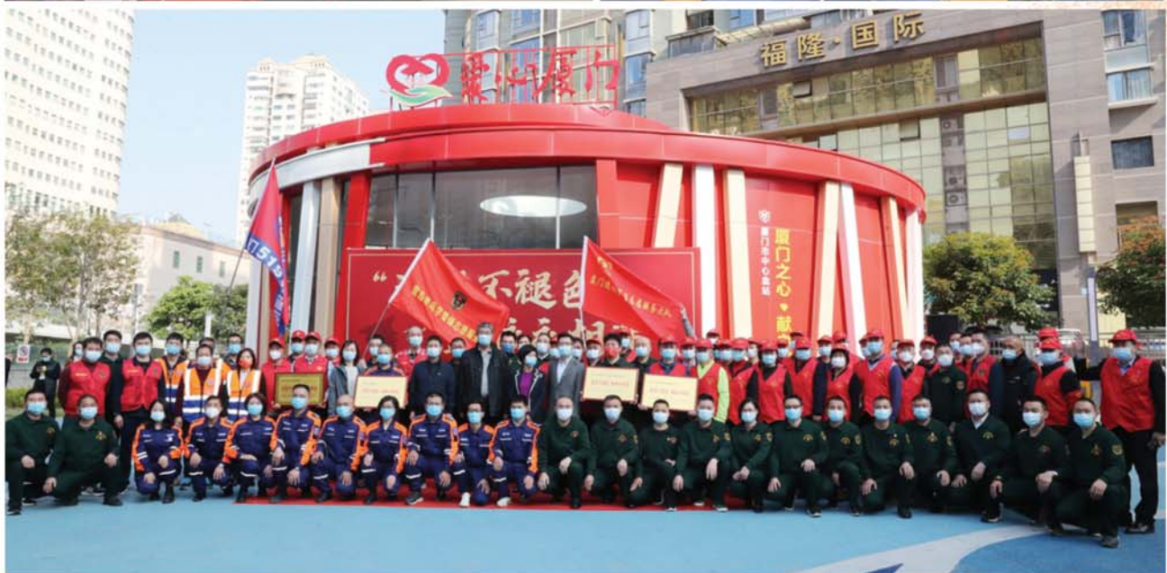
“鹭岛老兵”无偿献血由“单兵作战”到“联合作战”