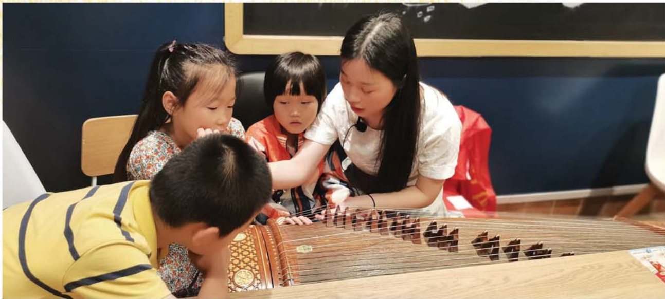
古筝乐器课程活动现场