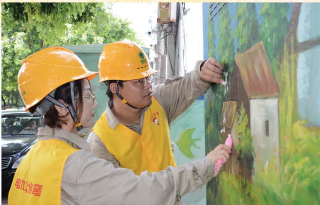
国网莆田供电公司“电力义修哥”志愿服务队美化环网柜。