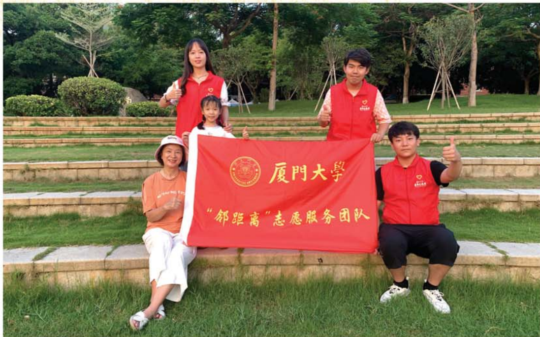
志愿者带领老少组合游厦大