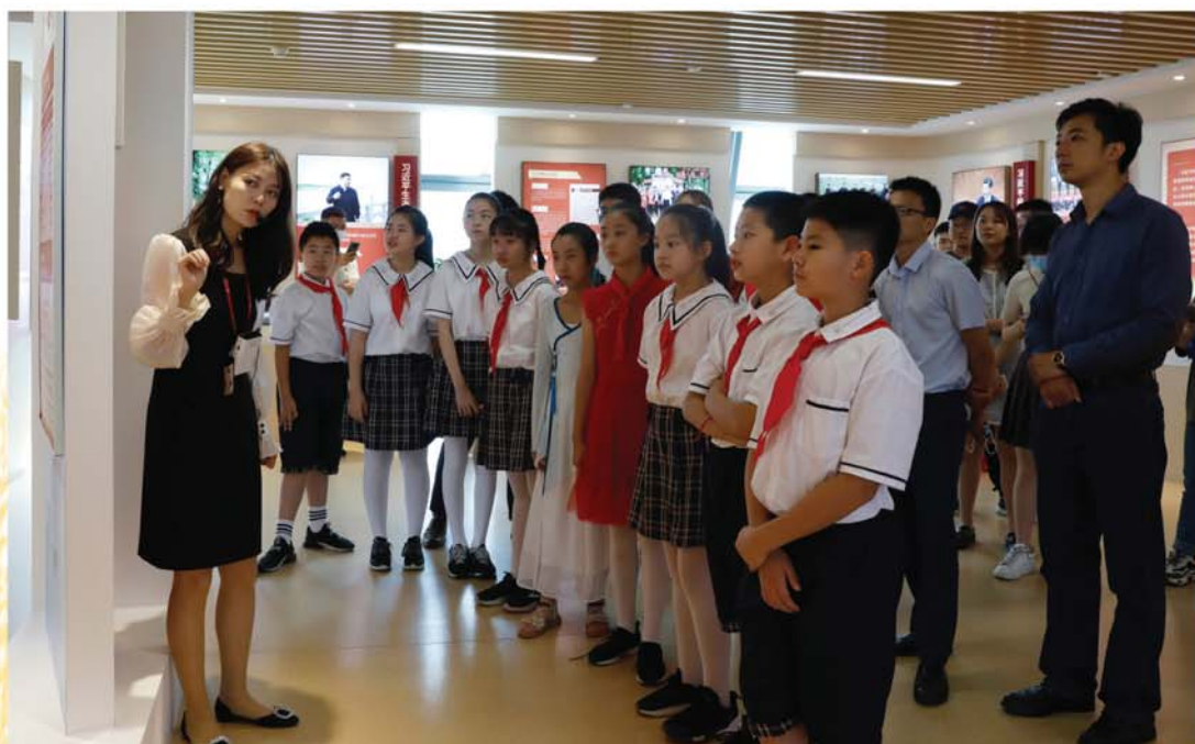
中信银行福州分行党建馆与2021年8月22日开展“学习新思想 奋斗新征程”全民学习宣传志愿服务活动——青少年专场