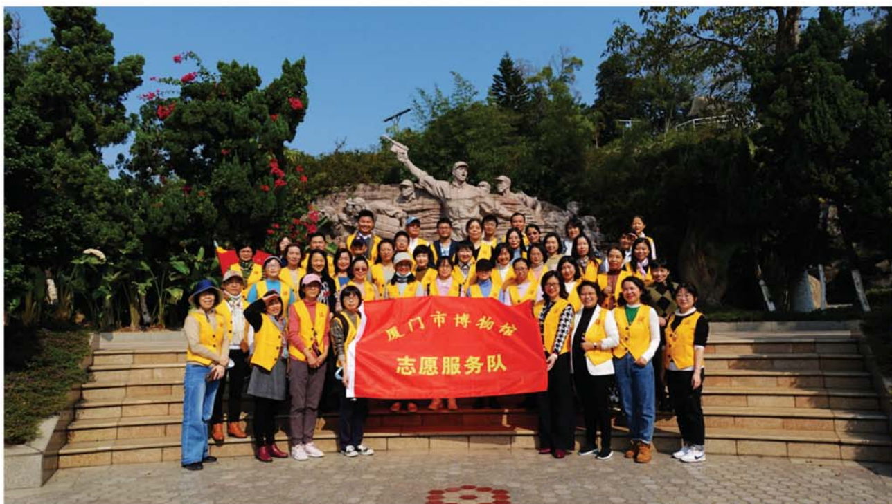
厦门市博物馆志愿服务队

我们的优势： 项目是为听障儿童专属打造的文化志愿服务项目，在全国屈指可数。立足博物馆文物资源和志愿者文化服务专长，开展特色文化教育服务；线上线下联动，打造沉浸式学习氛围；对接市残联，与特校、聋人协会共建，推进项目精准化运行，将文化服务惠及全市听障群体。