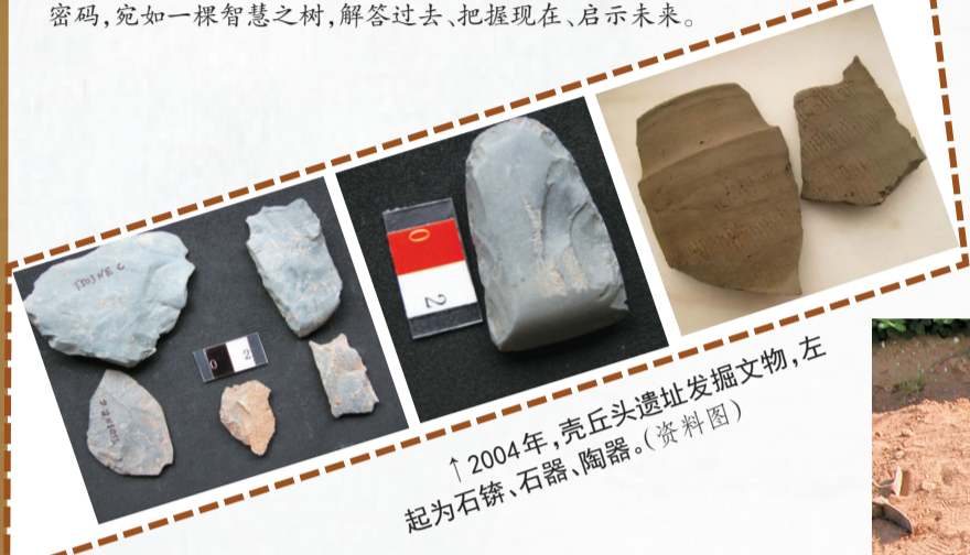
2004年,壳丘头遗址发掘文物,左起为石铤、石器、陶器。(资料图)