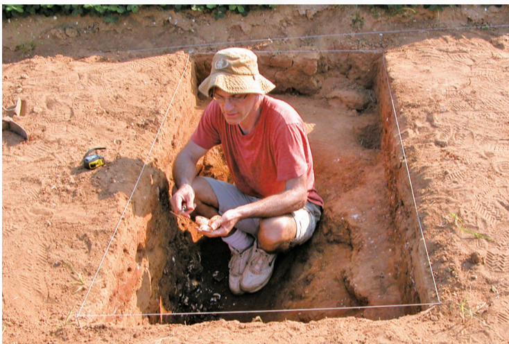
2004年,美国考古学家罗莱在壳丘头遗址发掘现场。(资料图)

文物传承灿烂文明,传承历史文化。过去,我在这片土地,遥望着先民驾着独木舟,先到中国台湾岛再扩散至太平洋各岛屿。现在,我想,能否通过做好“有段石铤的传播扩散”这篇文章,讲好中国与太平洋岛国的历史渊源,为深化互信、拓展交流与合作注入新的强大动力。