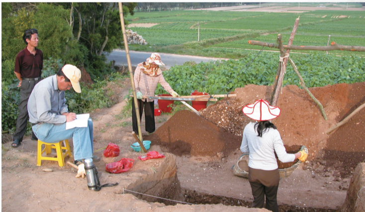
2004年,福建省博物院工作人员在壳丘头遗址发掘现场。(资料图)